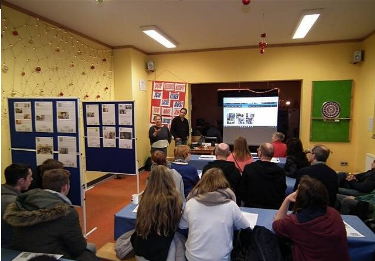
Projekt "Lesen?KraSS!" im Kinder- und Jugendzentrum DOMIZIEL unter Mitwirkung des Fördervereins "Buchstützen Blatzheim".