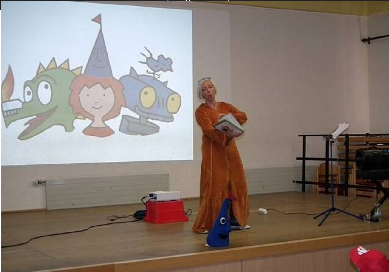
“Ritter Rost” im Kunibertus-Haus auf Einladung des Fördervereins “Buchstützen Blatzheim”.